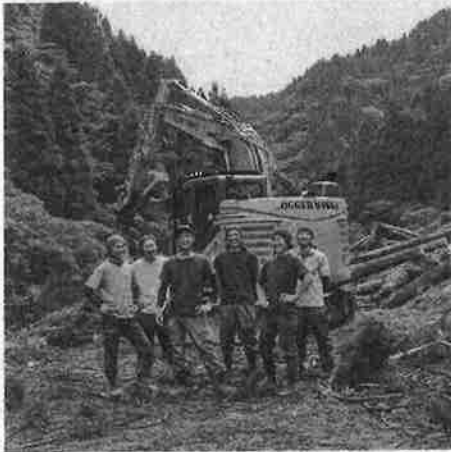
▲ ロガーワークス(株)の皆さん