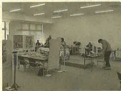
▲ 森林の仕事ガイダンス