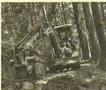
▲ 環境に配慮した作業道の開設