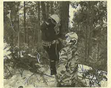
▲ 林業のお仕事見学会