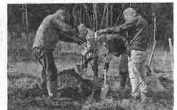
▲ 地域での植樹活動（大野市）