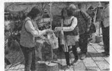
▲ 緑化木の配布活動（鯖江市）