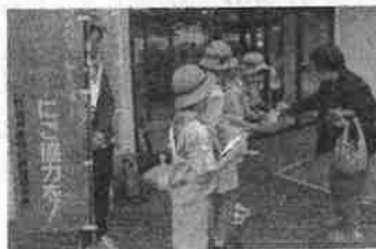
▲ 街頭募金活動（小浜市）