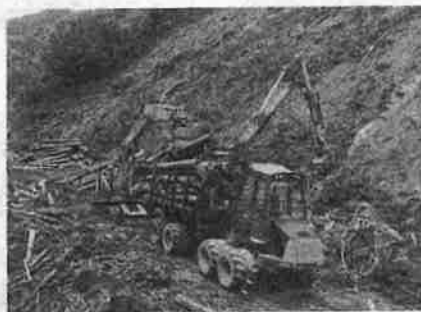
▲ 主伐地での素材生産

同社は高性能林業機械の導入や「木を高く売る採り方」の追求を進め、従業員のスキル向上に力を注いでいます。また、作業日報アプリの活用などDXを積極的に推進し、作業管理や事務業務の効率化を実現しています。