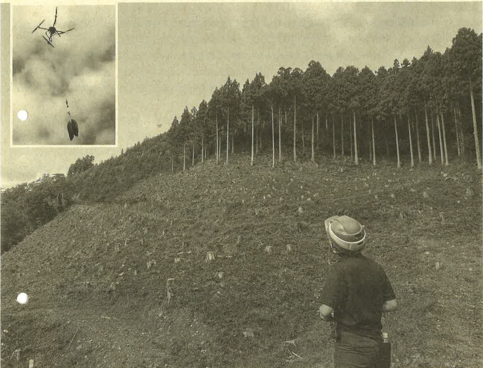
ドローンによる苗木運搬