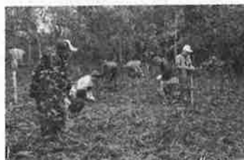
▲ 森林ボランティアによる森づくり活動（永平寺町）