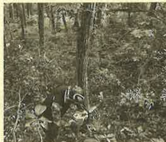
▲ 安全に配慮した森林整備の実施