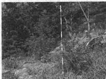
▲ 試験区の状況（福井市 市ノ瀬地区）

特定苗木品種と県産スギを同じ植栽地に植え付け、福井の気候下で生育させながら材質の測定・比較を行います。立木状態