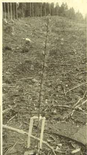
福井市美山町（主伐・再造林の施工地）