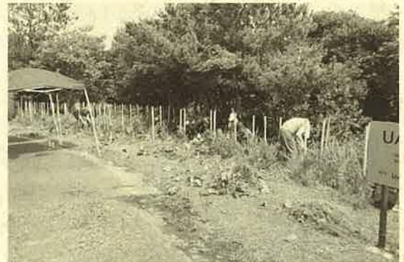
▲ 令和4年7月16日 下刈り

植栽後の5月14日と7月16日に下草刈り、3月18日には抵抗性マツ40本の補植を実施しました。毎回、総務部が社内ボランティアを募集し、集まった従業員やその家族がボランティアとして森づくりに関わっています。7月16日と3月18日はあいにくの雨となりましたが、海のすぐそばというすばらしい立地条件の中、参加者は気持ちのいい汗をながしていました。海岸の最前線でこの抵抗性マツが成長し、防潮防風等の観点からも地域環境がさらに良くなることを期待します。