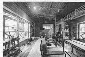
美容室の木造・木質化