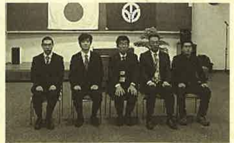
校長、副校長と8期生