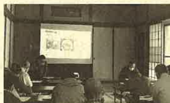
香福茸生産者の講義

午前中は座学で香福茸生産者から生産者目線での注意点や生産に向けてのアドバイスをもらいました。午後からは座学会場に隣接する香福茸生産者のほだ場に移動して、種駒の植菌間隔などについて説明を受けた後、実際に原木にドリルで穴を開け、植菌を行いました。植菌した原木は研修生が持ち帰り、それぞれの場所で栽培を進めています。今後は巡回指導により栽培状況を確認し、研修生の生産意欲を高めていきたいと思いをします。