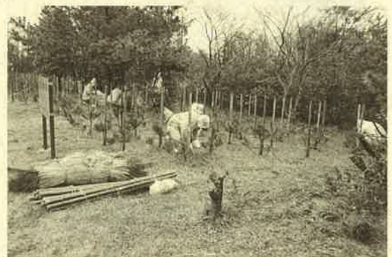
▲ 令和5年3月18日 補植