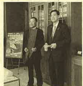
世界選手権出場のため 小浜市長表敬