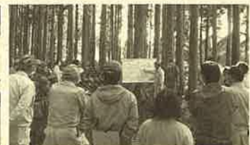
植菌間隔等の説明