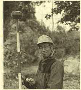
境界確定のための測量作業