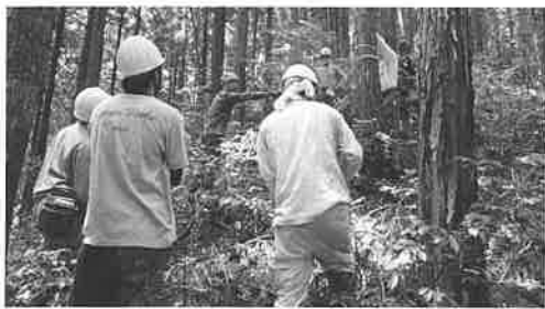
現地踏査、線形の決定実習の様子