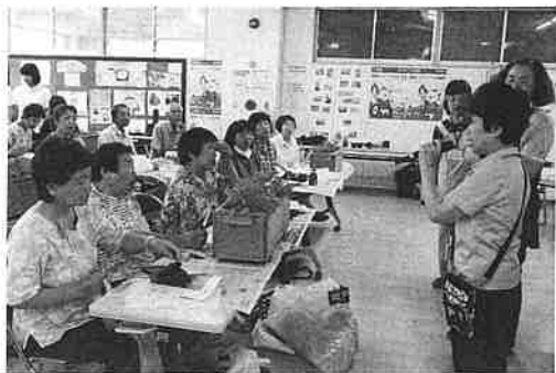
花の切り戻し実習