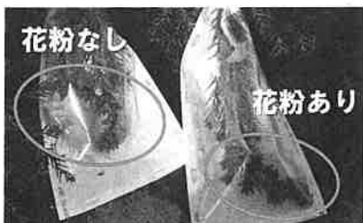
写真1 袋かけによる無花粉スギの検定状況

さらに第2段階で は、このF1同士を人 工交配させることに より、雑種第2代(F 2)を作出させます。