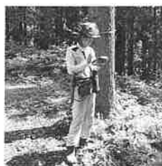
GPS測量をしている様子