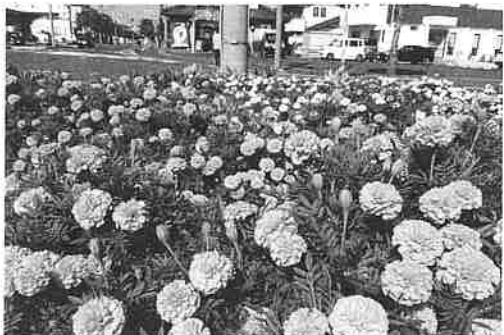
満開のマリーゴールド

ハサミを入れていた参加者の 皆さんですが、徐々に思い切 りよく刈り込むことができる ようになりました。