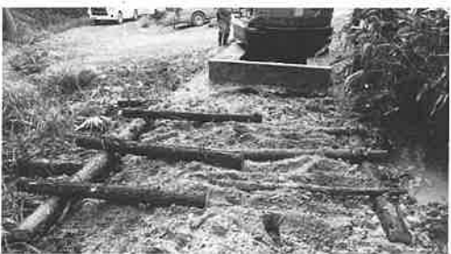
現地資材利用による丸太組み

去る7月10日～12日、平成30年度林業担い手スキルアップ支援事業（作業道開設技術の向上研修）（公財）福井県林業従事者確保育成基金）が開催され、県内の森林組合等から約20名が参加しました。