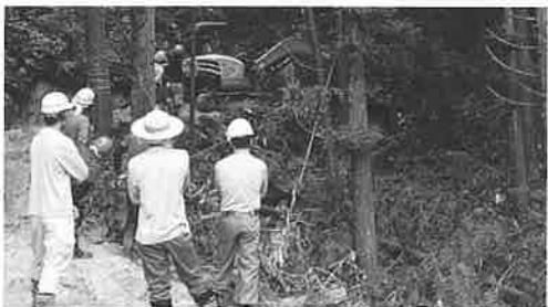
開設技術実習の様子