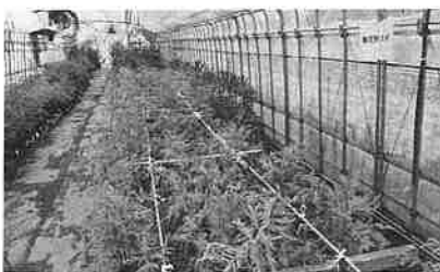
写真2 平成30年に開発した県産無花粉スギ

この段階で約4分の1の確率で無 花粉スギが出現します。このF2 から無花粉スギを選抜するため2 力年にわたり花粉の有無を確認す る検定を行い(写真1)、無花粉ス ギが開発されました(写真2)。 今後の予定について 総合グリーンセンターでは種子 供給による増産体制を計画してい ます。今後、無花粉スギを増産し ていくため、平成30年度より閉鎖 型採種園を造成します。県産無花 粉スギの雌花と花粉をつけない不 稔の形質を支配する遺伝子を持つ スギの雄花を交配させることによ り約2分の1の確率で無花粉スギ の種子を生産することができます。 平成32年度より苗木生産者へ種 子を生供給し、将来25,000本分 の苗が生産される予定です。