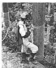
獣害防除ネットを巻いている様子

カレッジでは森林・林業に関する様々なことを学び体験し、インターンシップを通じて山に関心を持つきっかけとなった池田町の森林組合で働くことを選びました。