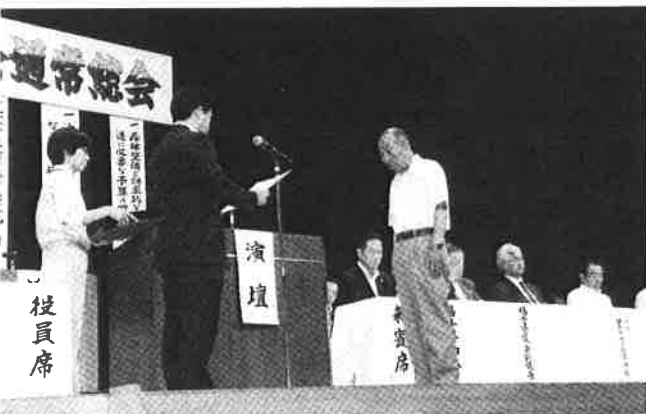
▲表彰を受ける受賞者