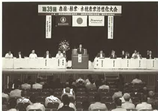
▲西川一誠知事によるご祝辞

最初に、大会委員長である県森連 関孝治会長より、「森林・林業・木材産業を取り巻く現況としては、木材価格の低迷、担い手の減少、境界問題等により森林所有者の山離れが加速している。このような状況の中、国では森林環境税の創設に向けた動きが見られ、県内では「みんなでつかおう「ふくいの木」促進条例」が制定され県産材の利