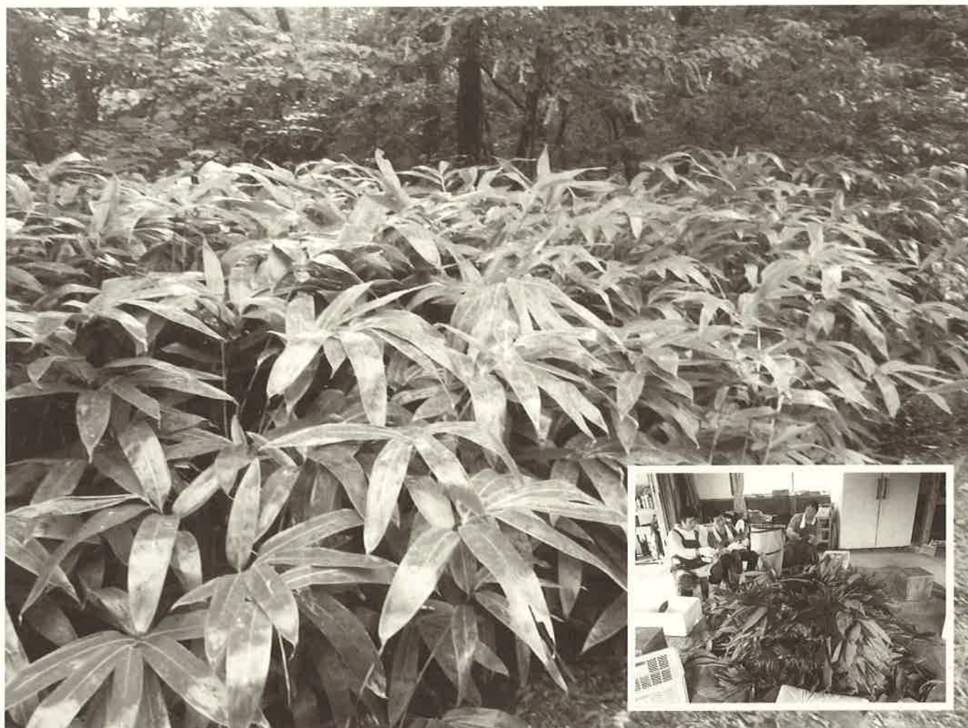
越前市内で収穫が盛んなササの葉。女性グループが活躍しています。