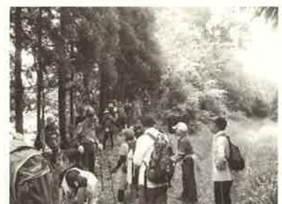
▲越知山泰澄トレイル