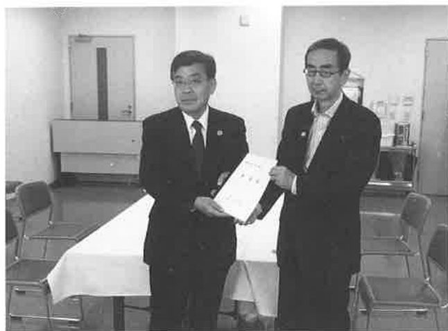
▲林野長官へ要望書手渡し