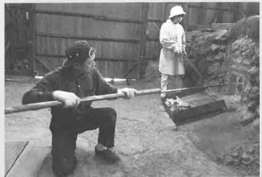
▲研磨炭の窯出し作業