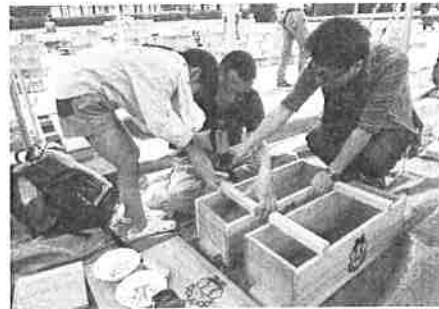
▲木製プランターカバーづくり