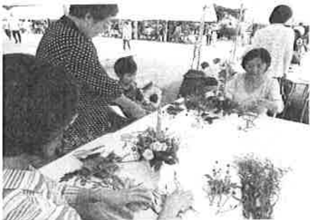
▲フラワーアレンジメント体験