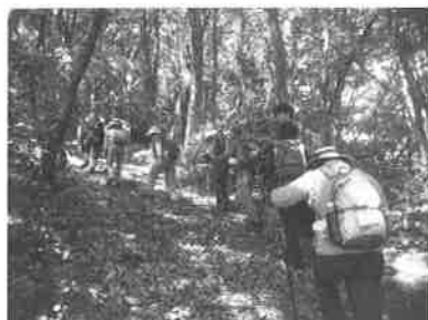
▲ウォーキングの様子