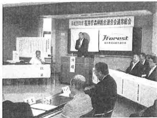
▲ 石塚副知事による来賓祝辞